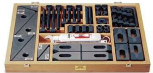
Satz mit Tiefspannbacken Nr. 296500