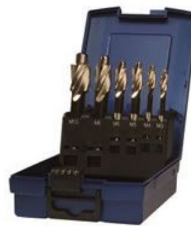
112000 Gr. 7K