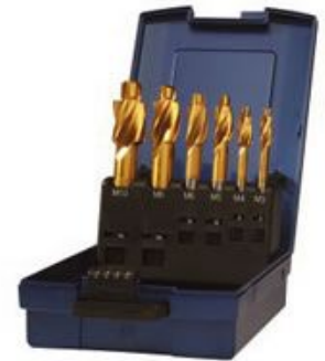
112050 Gr. 7K/TiN

112000 PRECITOOL, 高速钢, 小型 112050 PRECITOOL, 高速钢, 中型 112100 PRECITOOL, 高速钢, 钻芯孔