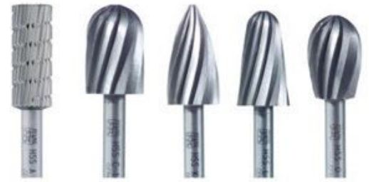
A 1625 ST C 1625 K 1630 L 1630 O 1625