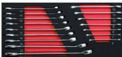
详见样册编号 519000 5999-011