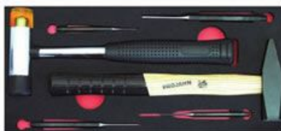
详见样册编号 519270 5999-101