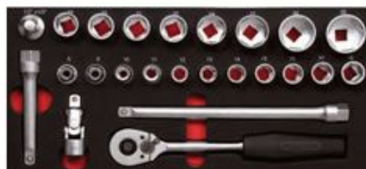
详见样册编号 519320 5999-131