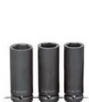
Kraftschrauber-Einsätze 加强套筒组 加长款 17, 19, 21 mm