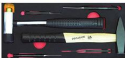
详见样册编号 519270 5999-101