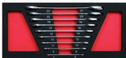
详见样册编号 519020 5999-021