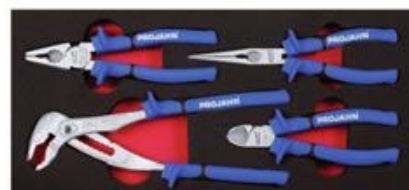
详见样册编号 519242 5999-082