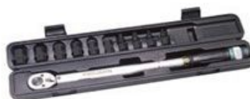
扭矩扳手1/2" 四方头驱动, 40 - 210 Nm 盒装

加强套筒组加长款17, 19, 21 mm, 带塑料防护套可无损伤地对铝轮毂工作, 带颜色差异, 可快速查找不同的套筒