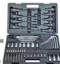
套筒组套适用内外TORX - 螺丝, 67件套