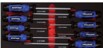
详见样册编号 519200 5999-065