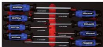
详见样册编号 519200 5999-065