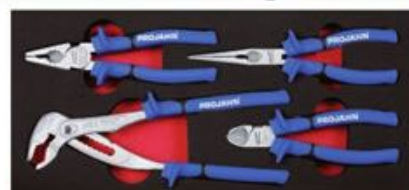
详见样册编号. 519242 5999-082