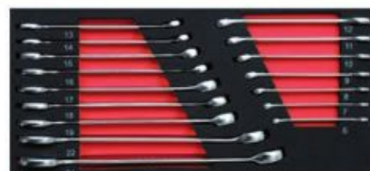
详见样册编号 519000 5999-011