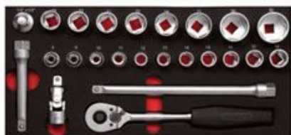
详见 样册编号. 519320 5999-131